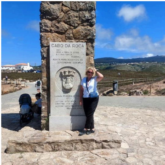
Európa legnyugatibb pontjánál Belémben