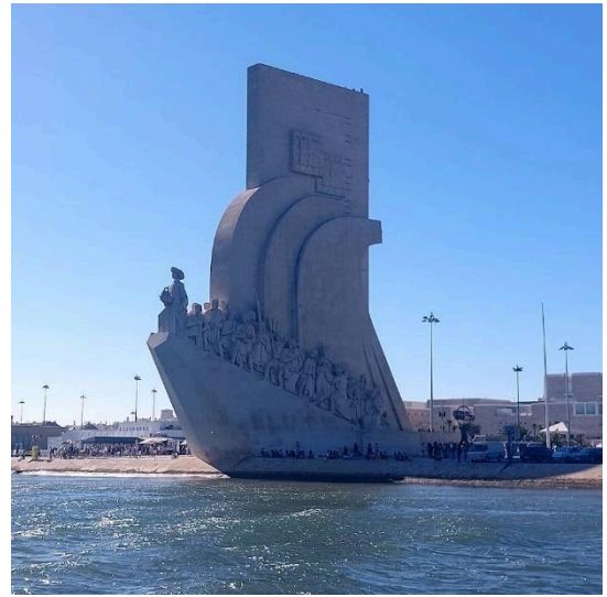
A Felfedezés emlékműve