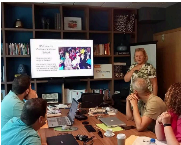
Welcome to the Children's House School

A szellemi fáradtságot délutánonként és hétvégén rengeteg gyaloglással, utazással pihentem ki. Igyekeztem a gyönyörű Lisszabont és környékét felfedezni, s mivel erre kevés volt az első munkás hét, boldogan maradtam még egy hetet. És még delfineket is láttam!